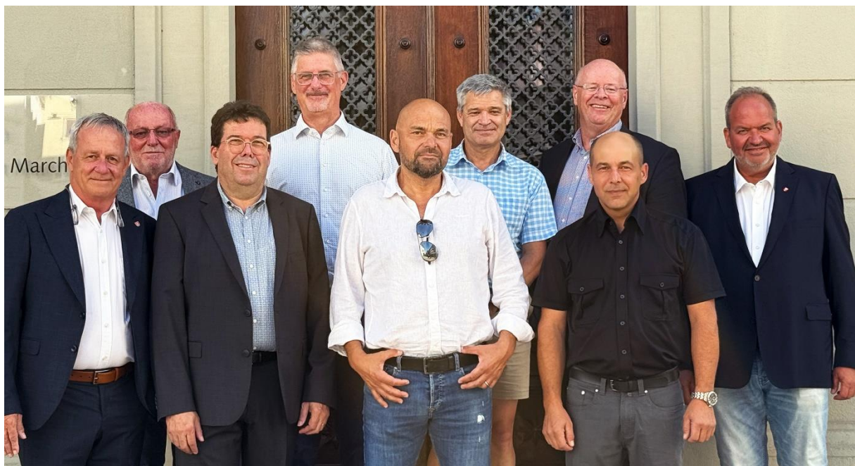
Bildlegende Foto Gemeindepräsidenten: Die Gemeinden sind sich einig: Mit der Versorgungsregion March soll eine zukunftsfähige, solidarische und koordinierte Lösung für das Leben im Alter geschaffen werden.